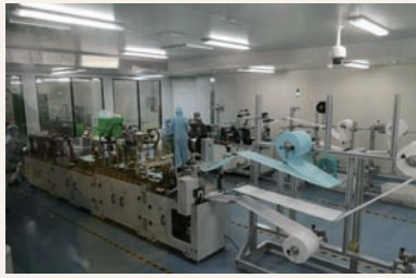
(口罩生产线竞赛现场)

防疫口罩生产竞赛主要集中在半自动N95柳叶型口罩的成型、缝纫、焊接、穿线与整理装袋的五道工序上。作为全新引进生产线，防疫口罩相关工序属于各班组的陌生地带，竞赛过程中，选手们不断优化生产流程与操作标准，不断打破生产记录。十四天的比拼，诞生了各道工序的总冠军与单班冠军：缝纫工